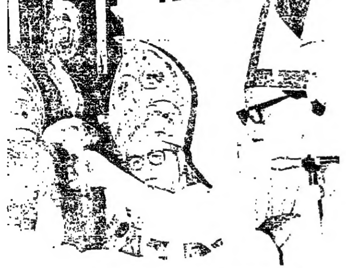
فيته يسلم العمارة الراعية من المخارطة